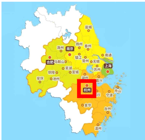
▲ 항저우시 위치